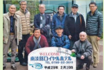
学生寮で一緒だった「郷友」仲間と気まぐれ旅

今は向都離郷者の親睦団体である多紀郷友会の連絡機関誌「郷友（きょうゆう）」の編集発行に携わり、故郷との「心の絆」の再構築に腐心中。道は遠く、険しいが、これも複雑骨折してきたわが人生の「遊歩」なのかも知れない。