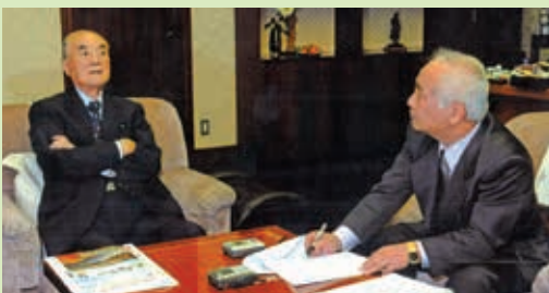
敬愛する中曽根元首相に取材（2008年11月）