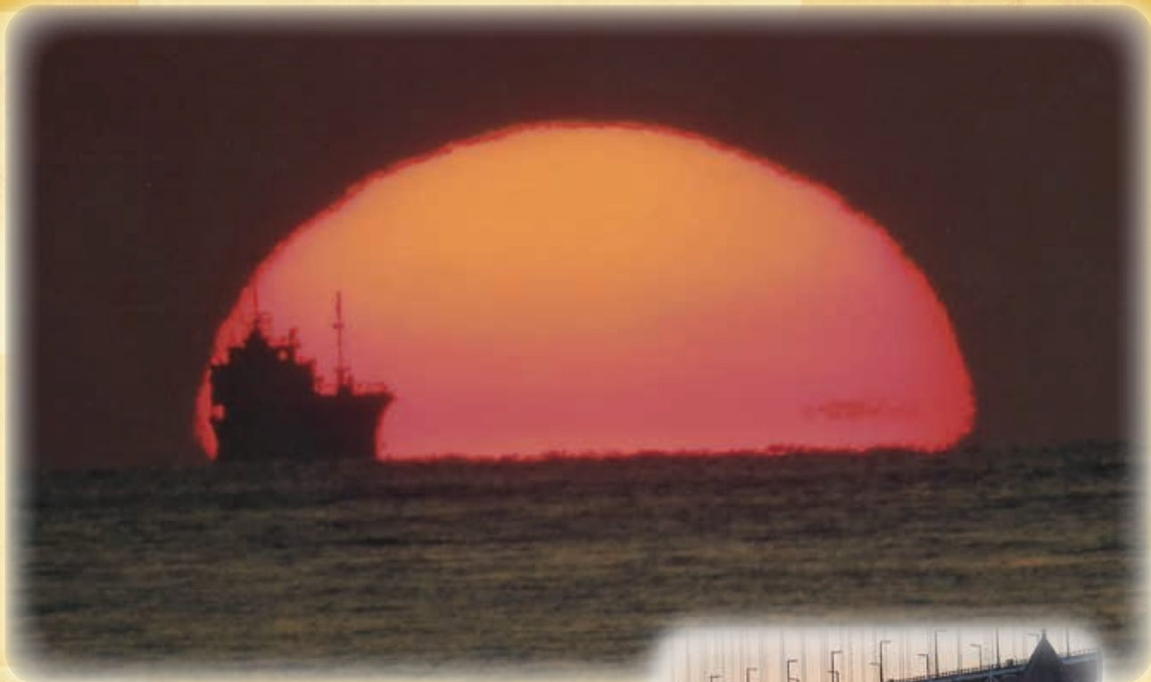
◎こがらしや 海に夕日を 吹き落とす (夏目漱石)

編集発行：(公財)神戸いきいき勤労財団 神戸市シルバー人材センター 〒651-0096 神戸市中央区雲井通5丁目3-1 (サンバル10階) ●東中部センター/241-2700 ●北区センター/596-3181 ●西部センター/621-6880 ●本 部/252-0316 ●西区センター/993-0066 電話番号はおかけ間違いのないようお願いします ホームページ http://www.kobe-sjc.or.jp