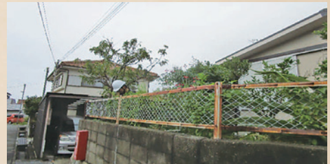
家の敷地内からも他の木を剪定。この日は3人での作業でした。