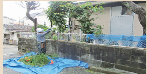
お客様からの依頼で敷地外にはみ出ている枝を中心に剪定します。