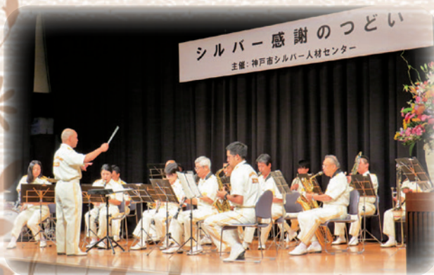
〈神戸市消防音楽隊の演奏〉