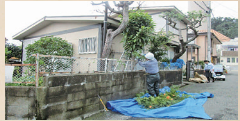
切った枝や葉が周囲に飛び散らないようにビニールシートを敷いています。

また刈払機による飛び石事故を防ぐため、防護ネット、養生は必ず行うようにしています。