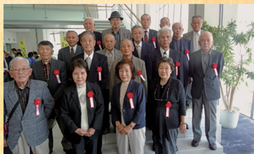
当日参加者の皆様で記念撮影を行いました。

当日は、約600名の方が参加され、他に事例発表として、西宮市シルバー人材センターより「会員増強への取り組みと今後の課題」、講演として「特殊詐欺の被害防止対策について」がありました。