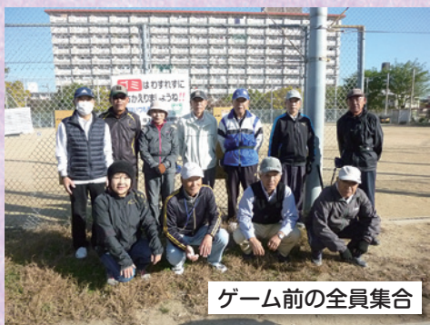
ゲーム前の全員集合

グラウンドゴルフは棒状の専用クラブでゴルフボールより大き目のボールを打ち、それをホールポストと呼ばれるゲートに入れるまでの打数で得点を競うスポーツ。ちょっとした広場があれば簡単にでき、高齢者の間で運動不足の解消になるなどの理由から人気があります。