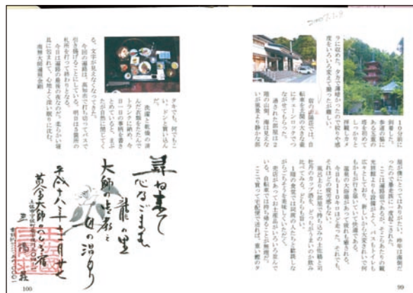
遍路の紀行本（パソコンで製本）

阪神淡路大震災の慰霊碑慰問を7年間、自転車同好会のメンバーで震災記念日に実施今年は有志で東公園から東灘の商船大まで7カ所慰霊碑の慰問をされたとのことでした。