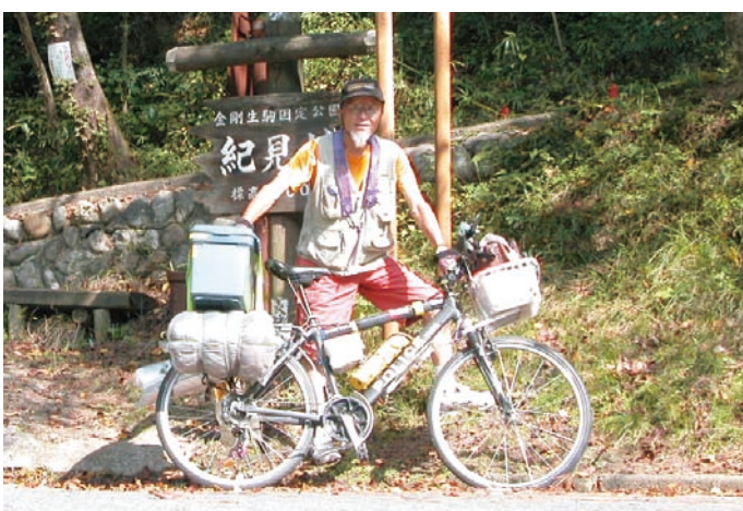
高野山までのロングランに挑戦