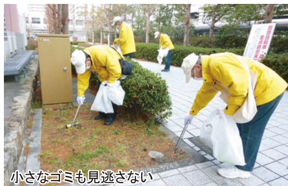
小さなゴミも見逃さない

・午前11時半。集めた可燃、不燃ゴミは事務所に持ち帰るがメンバーは「まだ時間がある」と再び近辺へ。