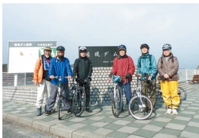
加古川市権現ダム訪問

趣味の園芸として15坪ほど菜園をされていて、季節の野菜をビニールシートで栽培されています。今年は風でビニールシートがはがれ大事に育てたブロッコリーが殆どヒョドリに食べられてしまったとのこと野菜作りも大変ですね。