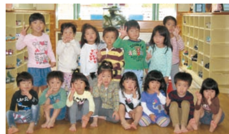
メダカが大好きな園児たち