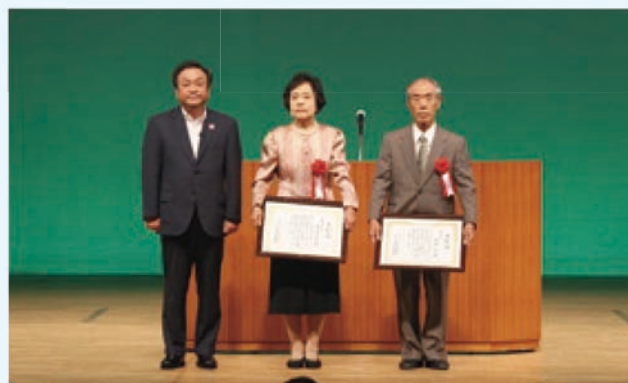
安全就業スローガン表彰