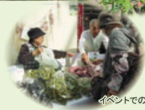
イベントでの販売風景