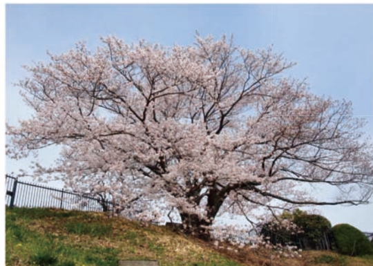
満開の奥平野舞桜

水の科学博物館の周辺には約200本もの桜の木が植えられており、桜の名所としても有名です。桜の開花時期には多くの方々が博物館を訪れます。写真の桜は樹齢70年を超える“奥平野舞桜”（市民からの愛称募集で