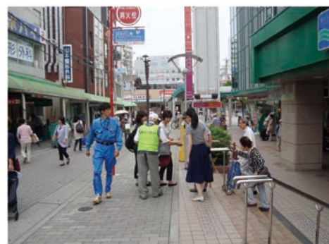
街頭キャンペーン

また、会員確保については、毎月の入会説明会に加えて、各センターで駅前や商店街などの街頭キャンペーンを実施するなど、入会促進に取り組んでいます。