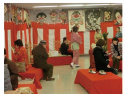
新春お茶席の様子